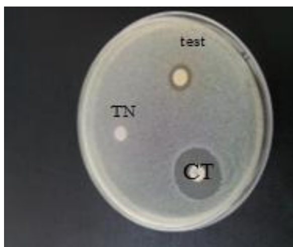
Figure 2 : Effet inhibiteur du désinfectant à base de Glutaraldéhyde sur la souche d'AB (TN : témoin négatif, CT : disque de colistine, test : désinfectant)

Les résultats, de l'activité antibactérienne sur la bactérie testée à l'état planctonique, montrent que le désinfectant a un effet inhibiteur sur AB et que le diamètre de la zone d'inhibition est de 12 mm, figure. 2.