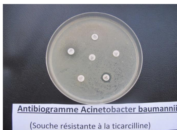
Figure 1 : Antibiogramme de la souche d'AB étudiée

La souche que nous avons choisie pour réaliser cette étude est Acinetobacter baumannii (AB), elle est largement impliquée dans les infections nosocomiales bactériennes au sein du service de réanimation de l'hôpital El idrissi de Kenitra selon une étude réalisée [6, 7,8]. C'est une bactérie multi résistante qui n'a gardée sa sensibilité que vis-à-vis de la colistine et de l'amikacine (figure 1).